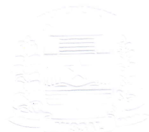
Eduardo Staudt Prefeito Municipal Em exercício

GABINETE DO PREFEITO MUNICIPAL DE MISSAL, 08 DE AGOSTO DE 2017.