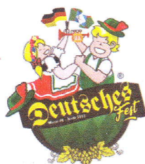
Eduardo Staudt Prefeito Municipal

GABINETE DO PREFEITO MUNICIPAL DE MISSAL, 10 DE SETEMBRO DE 2020.