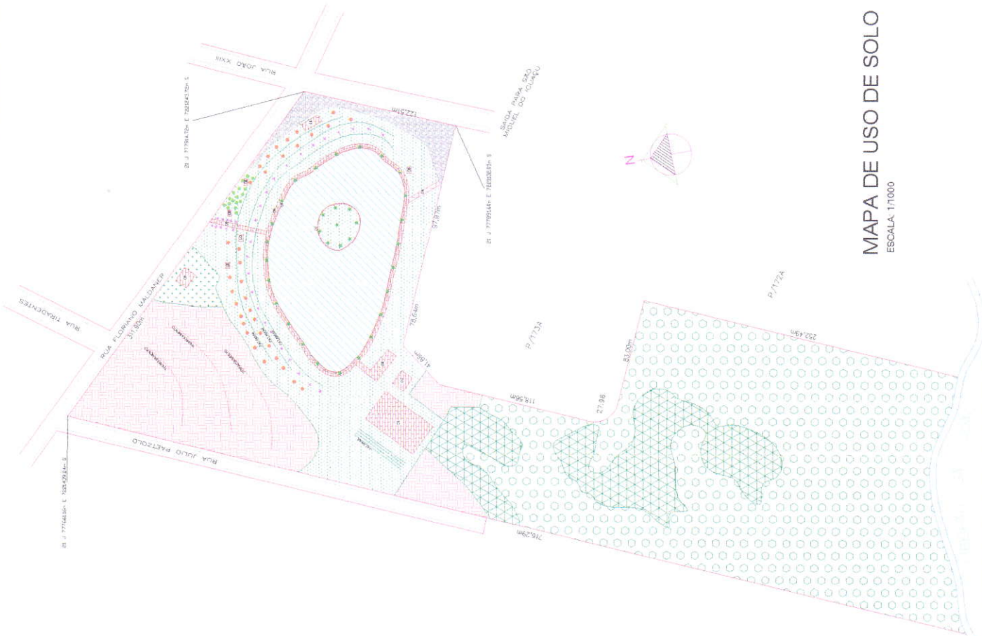
MAPA DE USO DE SOLO ESCALA: 1:1000