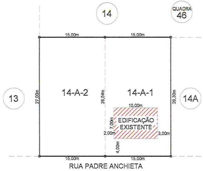
Situação Atual Escala Indicada