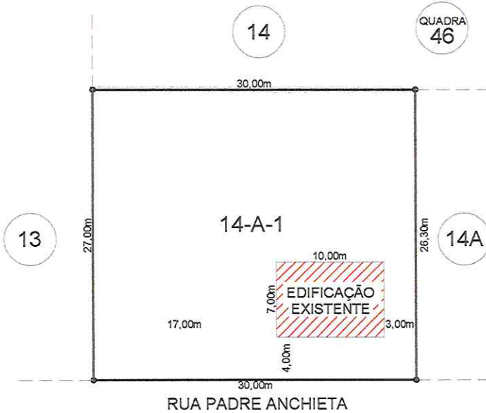
Situação Pretendida Escala Indicada