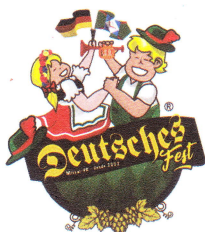
Eduardo Staudt Prefeito Municipal

Fone/Fax: (45) 3244-8000 CNPJ: 78.101.847/0001-50 Rua Nossa Senhora da Conceição, 555 Centro | Caixa Postal 01 | 85.890-000 | Missal | Paraná